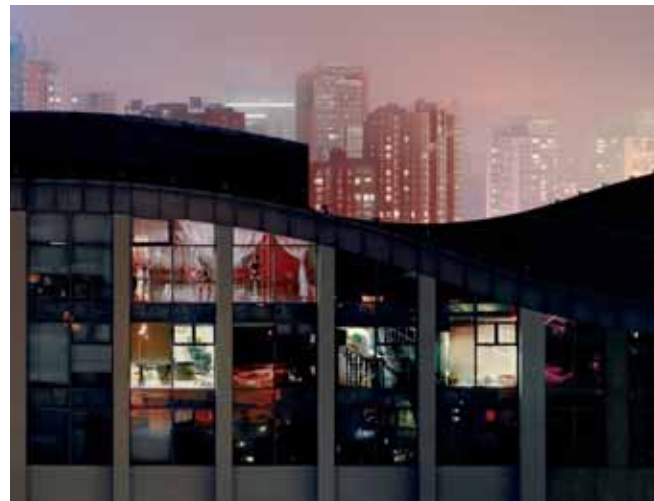
« Pékin 214 » • 2009 • 120 x 150 cm • Tirage Lambda sur papier Kodak Metal, encadré en caisse américaine avec verre anti-reflet

Ancien étudiant des Beaux-arts de Paris, il est établi aujourd'hui dans son atelier, et travaille chez lui.