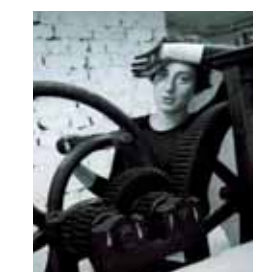
« Couverture de façade » • 2008 • 160 x 120 cm Xylogravure-Bois perdu en 3 couleurs

Il vit maintenant en Inde avec sa famille, et pratique plus que jamais son activité.