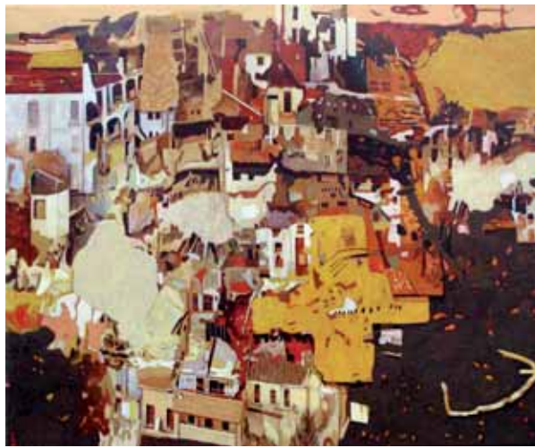
« Séisme n°4 » • 2010 • 54 x 65 cm • Acrylique sur toile

Floriane travaille principalement avec des galeries d'art (Galerie Paris-Beijing) mais aussi en publicité (agence Laurence Boué, Paris) et pour la presse internationale.