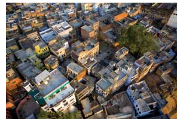
« Varanasi rooftops » • 2006 • 60 x 90 cm • Photo aérienne par cerf-volant

Les lignes fuient, l'image se volatilise, la forme se perd, et entre les lignes, l'imaginaire se crée.