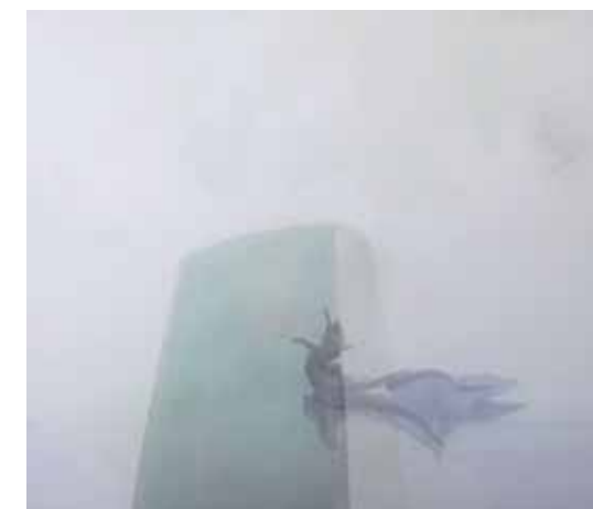
« A lizard spitted and spitted through the mouth » • 2010 • 190 x 220 cm Transfert photographique, acrylique, huile, vernis

Inspirée par mes voyages au cours de ces dix dernières années, j'ai assisté à la reconstruction de Beyrouth (Solidère) juste à côté des quartiers bombardés dans lesquels la vie était maintenue. Parallèlement, j'ai pu photographier la destruction des murs des immeubles de la Stasi dans un Berlin résolument moderne et artistique. Les photos seront présentées en dyptique et triptyque pour bien ressentir la différence d'intensité lumineuse des deux villes et le combat si différents qui quelque part les rapproche, Les murs s'effondrent et se reconstruisent pour des raisons majeures sur fond de guerre ou de changement de régime politique.