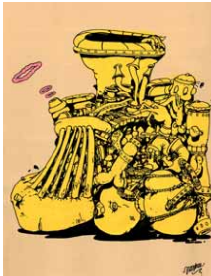
« piano loco » • 70 x 50 cm • acrylique sur papier